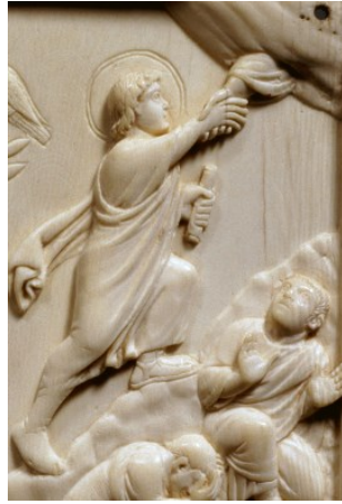
Bild: Aus der Sammlung Josef Martin von Reider, Bamberg. Inv.-Nr. MA 157, Bayerisches Nationalmuseum In: Pfarrbriefservice.de

und zum Hochamt an Christi Himmelfahrt, Donnerstag, 13. Mai um 9.30 Uhr